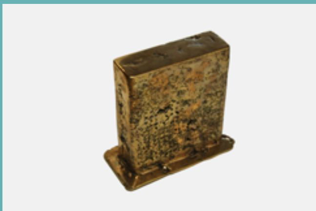
Louis Frehring, Internet ? , 2020. Bronze, dispositif électronique et programme informatique, 20 x 17 x 10 cm. © Louis Frehring.